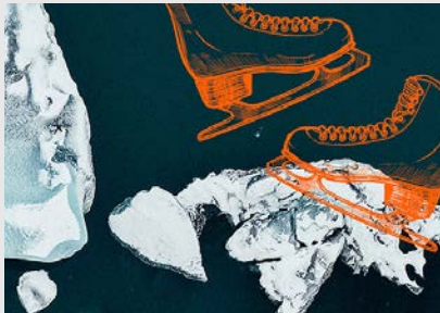
Gerlingen Auf Eis