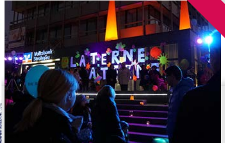
Lange Einkaufs- und Kulturnacht