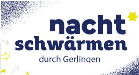
Nachtschwärmen durch Gerlingen